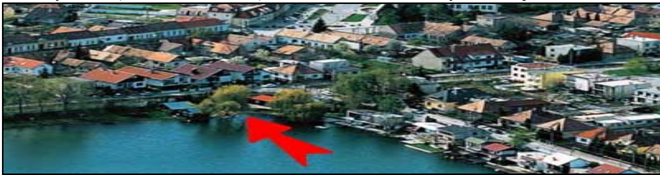
letecký pohled na základnu, kde jsme ubytováni

Pro VIP klientelu ☺ se mohu pokusit na místě sehnat ubytování v soukromí, ale pokud nechcete celý turnus (od neděle do neděle), tak si nelze rezervovat ubytování dopředu.